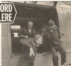
Besætningen på redningshelikopter U 277 satte i går hastighedsrekord i redningsflyvning.

De to mænd havde ligget i vandet i tre kvarter, da Værløse-helikopteren reddede dem for næsen af helikopteren fra Skrydstrup.